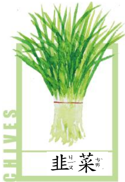
韭菜 (Jiu Cai)