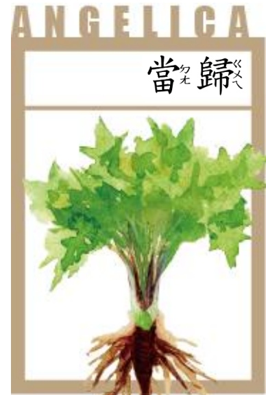
当归 (Dang Gui)