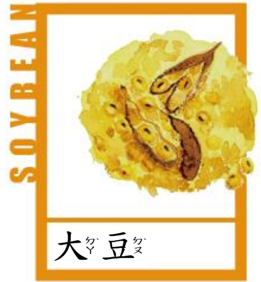
大豆 (Da Dou)