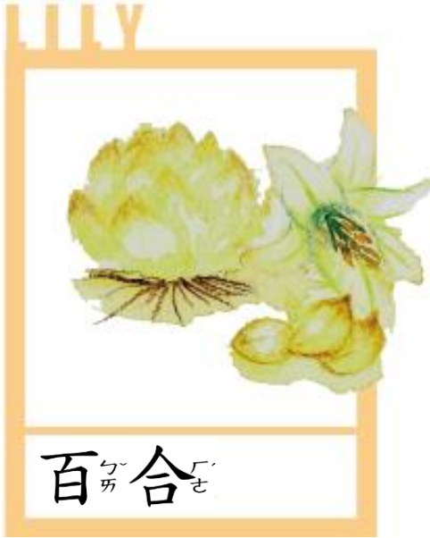
百合 (Bai He)