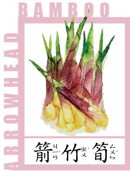
箭竹笋 (Jian Zhu Sun)