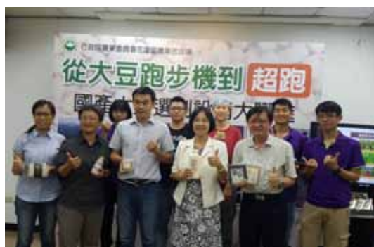
▲ 推廣新型國產大豆選別設備

轄區農場案例展示農業環境教育的意涵，並提供創新主題的四套農業環境教育教案，「農業缺工好幫手」介紹宜蘭及花蓮地區5個農業人力團標竿農務人員的從農歷程與心得。