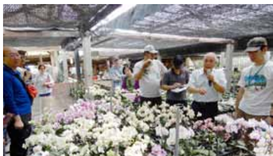
▲ 入門班學員參訪花卉產業及與達人交流

108 年度農民學院受訓學員對課程規劃、教學態度、教學方法、學員自我評及整體滿意度等均感到正面態度，而且在不同階層訓練（入門、初階、進階）的各項滿意度調查均達 4.20 以上，表示滿意程度在滿意至非常滿意間，辦訓成效獲得學員高度肯定。