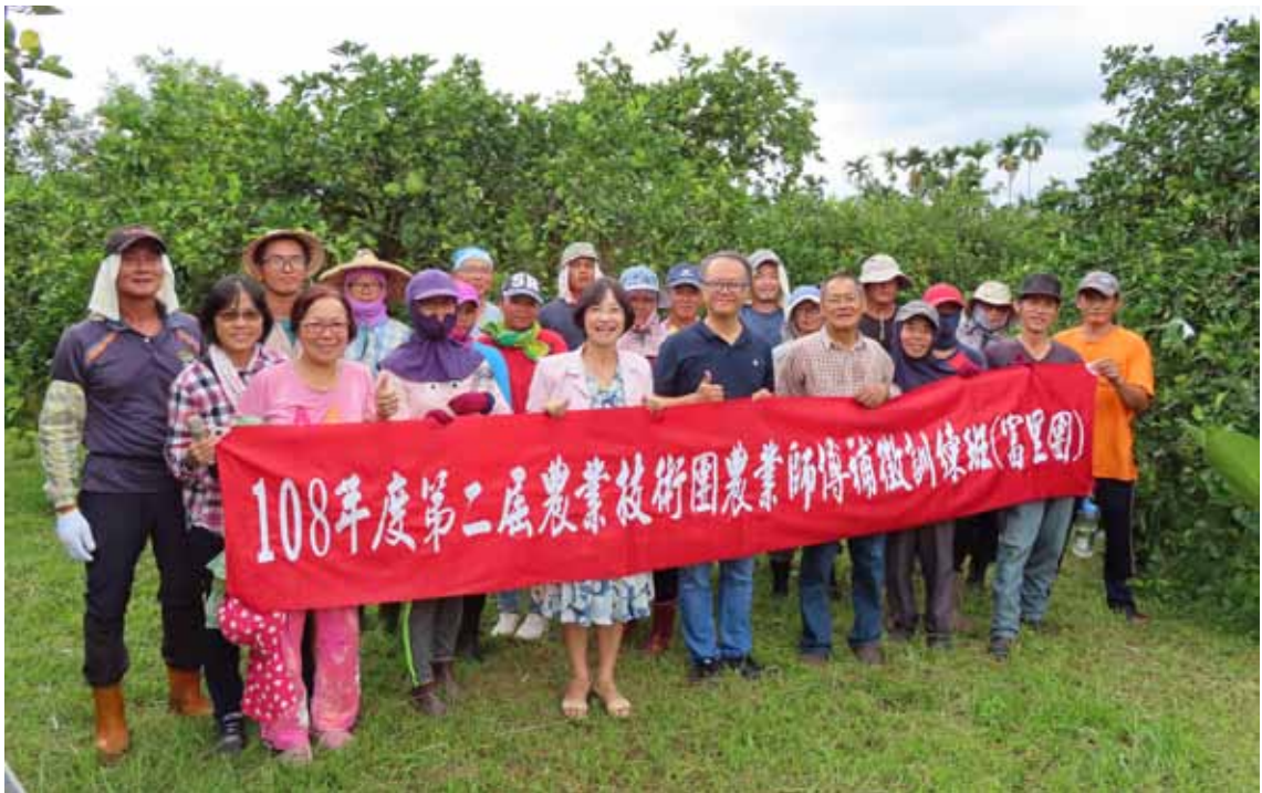
▲ 富里技術團補徵訓練於文旦園實習

本年度研究旨在探討訓練特徵、訓練遷移動機與訓練遷移行為間的關係，以及瞭解本場農民學院進階訓練參訓學員的訓練特徵、訓練遷移動機與訓練遷移行為。本研究採問卷調查法，研究對象為 2017 與 2018 年本場農民學院進階訓練之參訓學員，共郵寄 408 份紙本問卷，獲得有效回收問卷 100