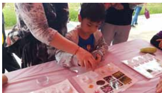
▲ 保種小學堂教小朋友辨識不同作物的種子

個銷售攤位，由在地青農、部落農友等展售生鮮農產品、熟食、點心等多樣產品，鼓勵民眾前來採買優質農畜產品，相招攜帶餐墊來野餐、聽音樂，參與寓教於樂的農業體驗活動。