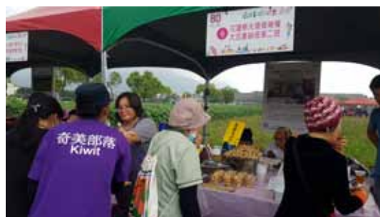
▲ 展售攤位吸引民眾參觀選購

個銷售攤位，由在地青農、部落農友等展售生鮮農產品、熟食、點心等多樣產品，鼓勵民眾前來採買優質農畜產品，相招攜帶餐墊來野餐、聽音樂，參與寓教於樂的農業體驗活動。