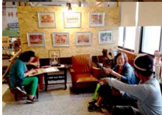
▲ 民眾參觀大事紀展，認識本場歷年重要業務成果及其時代意義

此外，為增加話題性及推廣轄區重要作物一文旦，與禾餘麥酒公司合作研發推出「80 週年紀念—柚花白玉氣泡飲」，該產品係由本場農產加值打樣中心研發萃取來自瑞穗鄉的有機文旦柚柚花，加入臺灣「臺南白」玉米及小麥製成，營養豐富，口感柔順，喝得到柚花香，還有細細的泡沫，不含酒精，於開放日活動當天推廣本產品，只要在展售攤位消費累計一定點數，即可兌換 1 瓶，民眾反應熱烈。🍷