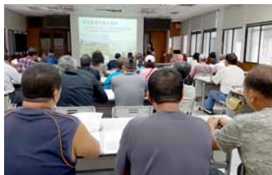
▲ 農友參與印尼青農來臺實習說明會踴躍

份，有效回收率 22.55%，採用描述性統計、單一様本 t 檢定、獨立様本 t 檢定、簡單與多元迴歸進行分析。本研究獲致下列結論：(一) 進階訓練內容的有效性佳且與參訓學員的工作相似度高，訓練遷移設計佳有助於參訓學員在工作中應用。(二) 進階訓練參訓學員的訓練遷移動機高。(三) 進階訓練參訓學員的訓練遷移行為表現佳且實務應用程度高，實踐所學的行為多且實踐成功。(四) 訓練特徵對參訓學員的訓練遷移行為有正向影響。(五) 訓練特徵對參訓學員的訓練遷移動機有正向影響。(六) 參訓學員的訓練遷移動機對訓練遷移行為有正向影響。(七) 參訓學員的訓練遷移動機在訓練特徵對訓練遷移行為關係間具有中介效果。