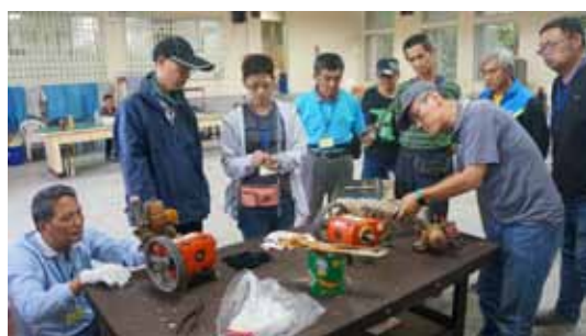
▲ 進階班學員操作農機具保養技巧