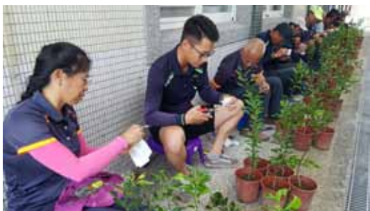
▲ 宜蘭技術團中級結訓考試檢核嫁接技術