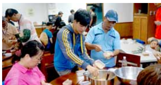
▲ 初階班學員學習製作有機味噌要領