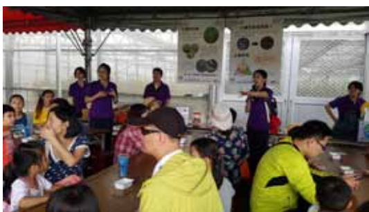
▲ 玩黏土認識土壤的質地與功用