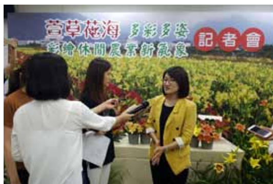
▲ 向記者說明萱草新品種及應用

出版5冊推廣專刊，「地景經營措施與環境回復力工作坊專刊」收錄該工作坊議程、專家簡歷、專題摘要及相關資料等，「丹參病蟲害圖說」介紹保健作物丹參上發生的病蟲害及防治方法，輔以清晰圖片供辨識，「東海岸的里山里海故事」敘寫在花蓮縣豐濱鄉新社村的新社及復興部落，公私部門合力推動里山倡議的故事，「東部生態農業：臺灣農業環境教育指南」透過