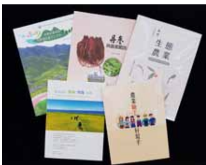
▲ 出版農業推廣專刊 5 冊

發布新聞稿及活動訊息等貼文 822 則，粉絲達 12,150 人，並利用臉書直播「地景經營措施與環境回復力工作坊」、「推動里山倡議以促進生物多樣性及增進人類福祉國際研討會」等重要活動共 2 次。