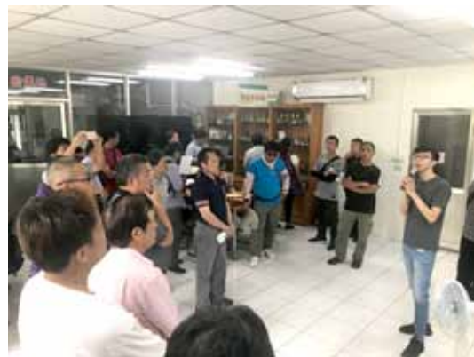
▲ 萬榮鄉公所率農友參訪本場農產加值打樣中心

積極維護本場 YouTube 影音播放頻道，108 年上傳研討會及農民學院相關影片 26 則，累計達 542 則，方便農友及民眾隨時線上收看，吸收農業新知，訂閱人數達 4,540 人。