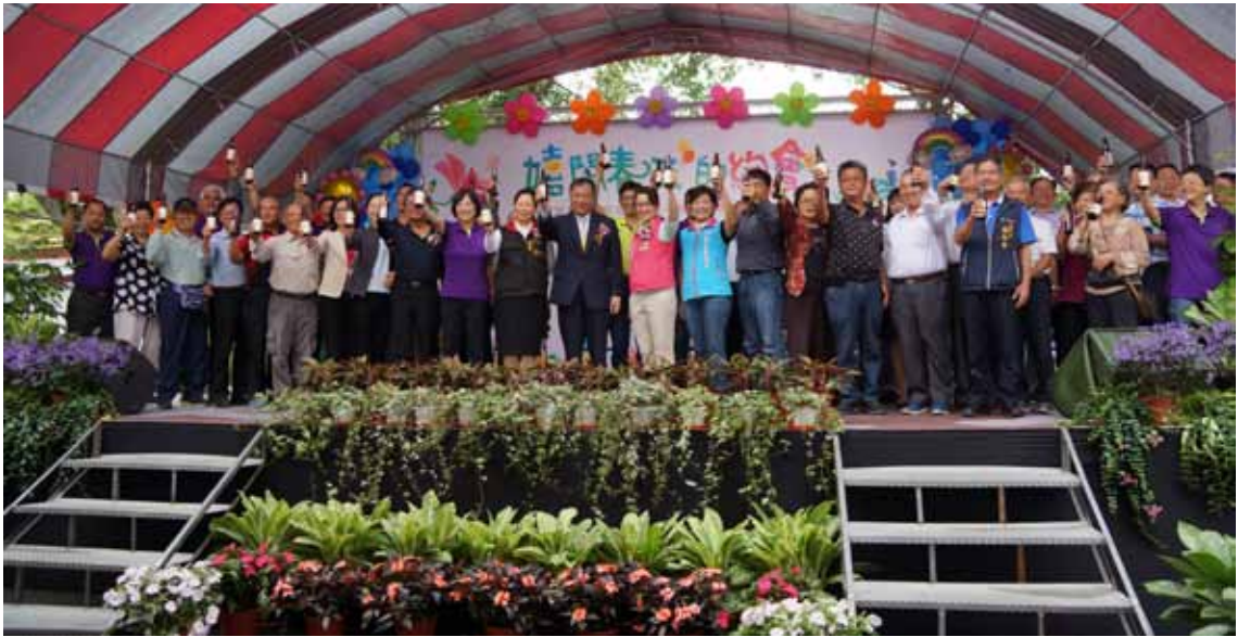
▲ 與會人員高舉柚花白玉氣泡飲，慶祝花蓮農改場 80 歲生日快樂