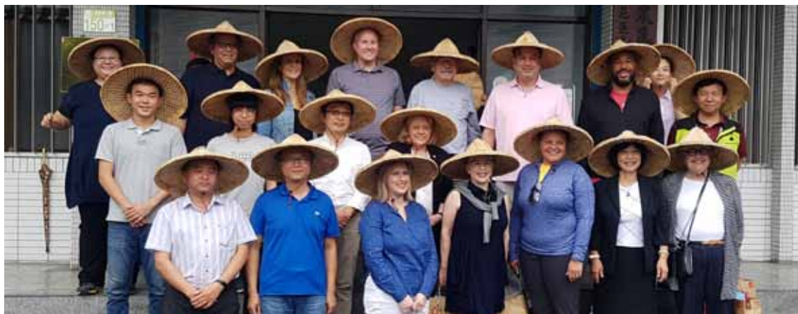
▲ 接待美國民主黨州主席協會 (ASDC) 訪問團