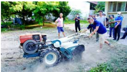
◆進階選修班學員學習中耕機保養及田間性能操作