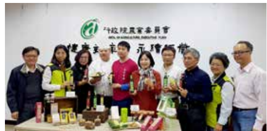
◆花蓮 1 號及 2 號大豆醬油系列產品上市發表會

發行農業推廣雜誌「花蓮區農業專訊」季刊 4 期、「花蓮區農情月刊」12 期及花蓮區農技報導 2 期，以即時提供試驗研究成果及重要農業政策，增進農民知識，提升農業競爭力。