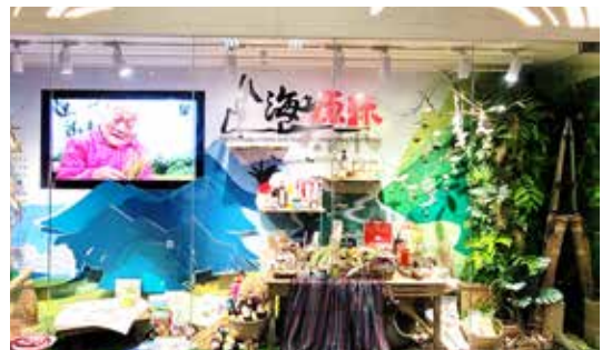
◆「山海原味」農業櫥窗，展示本場在原住民農產業之研發與輔導成果