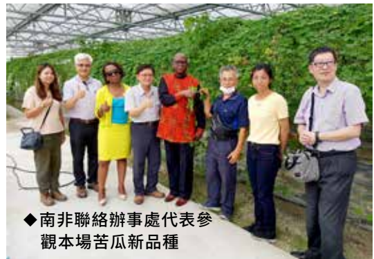
◆南非聯絡辦事處代表參觀本場苦瓜新品種

本次布展重點有 3 項，包括：種原保存、產業加值、食農體驗，依此 3 項主題設計展區。以種子樹吊掛本場收集的多種原民作物種子，陳列部落農特產品及本場打樣中心樣品，展示「Ina 的野菜廚房」桌遊、馬太鞍部落保種影片、食譜、出版品等，呈現本場進行傳統作物保種復育、栽培技術改進、加工產品研發，推廣野菜料理應用與保種智慧，輔導部落農友強化經營管理及發展六級化農業體驗活動。