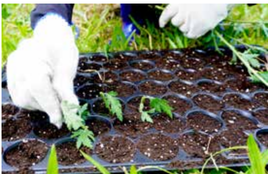
◆園藝入門班學員實際操作草本花卉植物扦插繁殖作業

班；溫網室搭建及修護班 1 班；休閒農業專班為休閒農業實務經營班 2 班，共計辦理 13 班，結訓人員共 379 位。