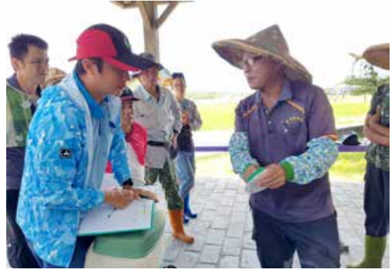
◆富里技術團高級結訓考試檢核農藥調配

本研究旨在以從農風險觀點探討影響花蓮區農民學院訓練中心從農與未從農學員的從農因素。研究對象為 108 至 109 年度參與花蓮區農民學院訓練中心共 372 位學員為主，採用網路問卷方式進行施測，回收有效問卷共計 347 份，有效問卷達 93.2%。運用邏輯斯迴歸分析影響從農風險評估因素基本資訊 8 項及從農風險屬性 13 項等自變項，與依變數從農與未從農之間的關係。研究結果顯示，影響從農與未從農學員的從農因素包含了「是否為農二代」、「個人/家庭擁有多少土地」、「(預計要/已)經營的模式」、「在一般情況下所能接受之農產品價格波動程度」、「加入農民組織的原因」、「曾經和其他想要從農者或已從農者分享哪些資訊」等 6 項因素。上述