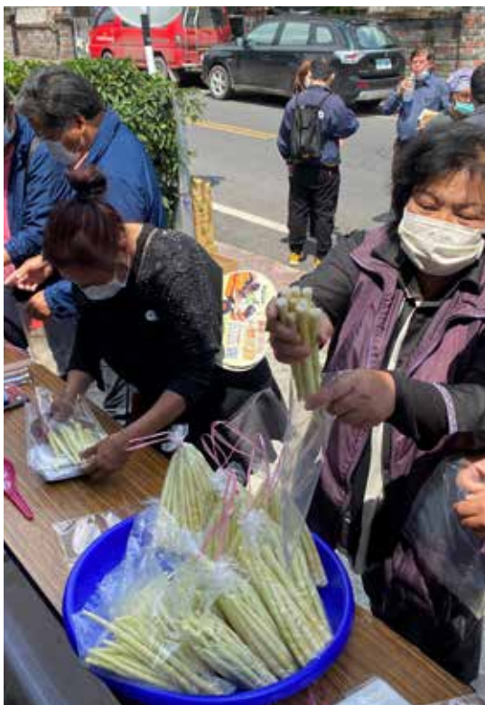
◆教授箭竹筍保存技術，紓解銷售壓力