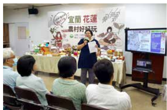
◆推廣本場輔導 19 個特色農業體驗據點及 8 條遊程