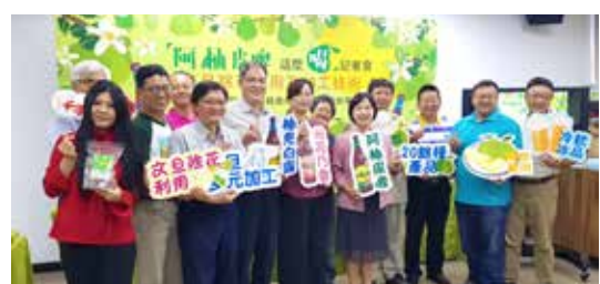
◆發表文旦除花技術及多元化加工研發成果