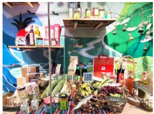
◆產業加值部分，陳列本場研發與輔導之原鄉部落加工產品