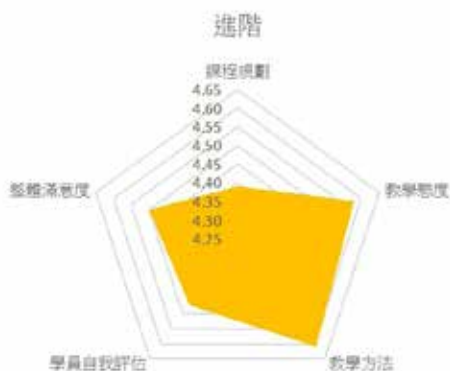
◆進階班學員滿意度調查結果