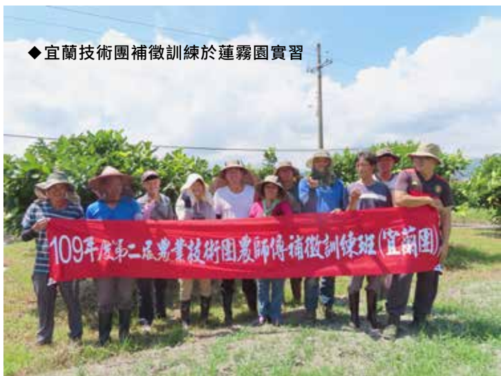
◆宜蘭技術團補徵訓練於蓮霧園實習

配合調度單位辦理農業師傅補徵，補充農業技術團所需人力，依轄區重要作物生產季節，辦理宜蘭及富里技術團補徵農業專業訓練班共 20 日、共計 258 人次參加。並辦理農業技術團回訓