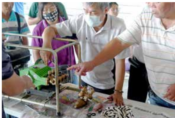
◆學習農機具修護，提升族人故障排除能力