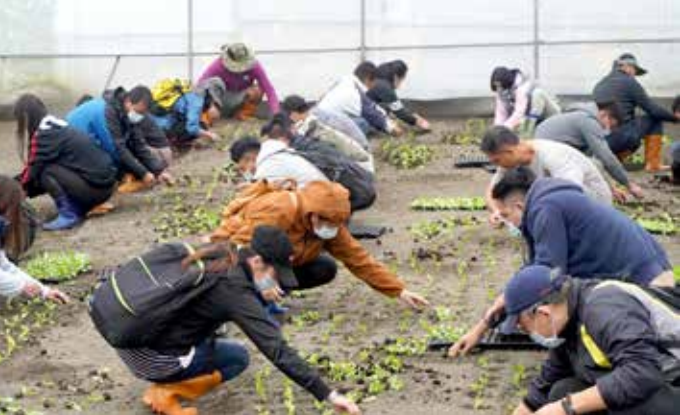
◆有機農業初階班學員學習蔬菜幼苗定植要領