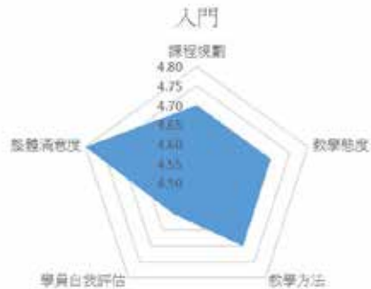
◆入門班學員滿意度調查結果

109 年度農民學院受訓學員對課程規劃、教學態度、教學方法、學員自我評估及整體滿意度等均感到正面態度，而且在不同階層訓練（入門、初階、進階）的各項滿意度調查均達 4.30 以上，表示滿意程度在滿意至非常滿意間，辦訓成效獲得學員高度肯定。