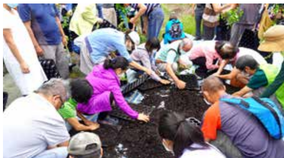
◆推廣新興野菜，振興部落傳統作物