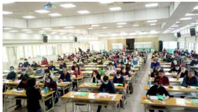
◆第二階段「管理制度與食品安全類」宜蘭場次假宜蘭縣農會大型會議廳辦理

花蓮兩場次共有 289 位考試成績及格。109 年初由本場協助食品工業發展研究所辦理第二階段「管理制度與食品安全類」，宜蘭花蓮兩場次共有 252 位考試成績及格並取得結業證書。