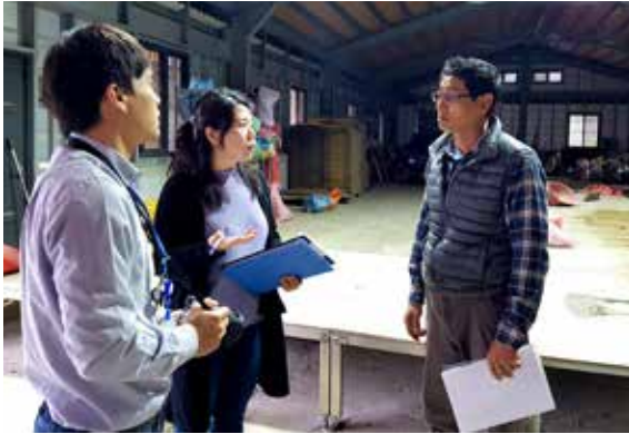
◆配合農委會及農科院辦理印尼青農申請案農場實地審查

為推廣新增外國農業人力供給管道，協助農委會辦理外籍移工外展農務服務計畫執行座談會 1 場次，共計 19 人參加，協助辦理印尼青農在台實習計畫申請農場審查 11 件，審查合格者計 6 件。