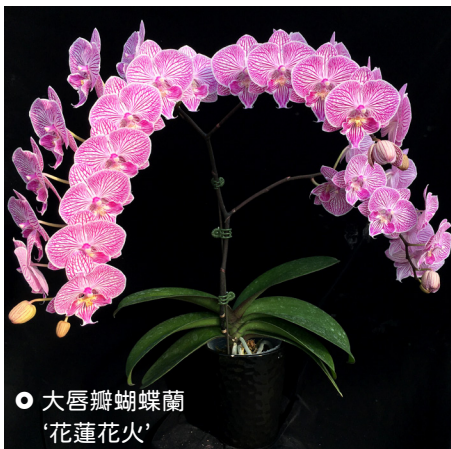
○ 大唇瓣蝴蝶蘭‘花蓮花火’