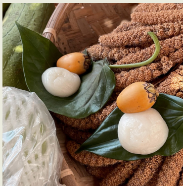
祭儀中不可少的檳榔與 toron

糯米是祭儀上重要的祭品，跟日常食用的白米不同。而 falinono 產量少，香氣濃郁，更是物以稀為貴，在太巴塢祭儀時，還會有家族的規定，會準備紅糯米跟白糯米，來表達最高的敬意。