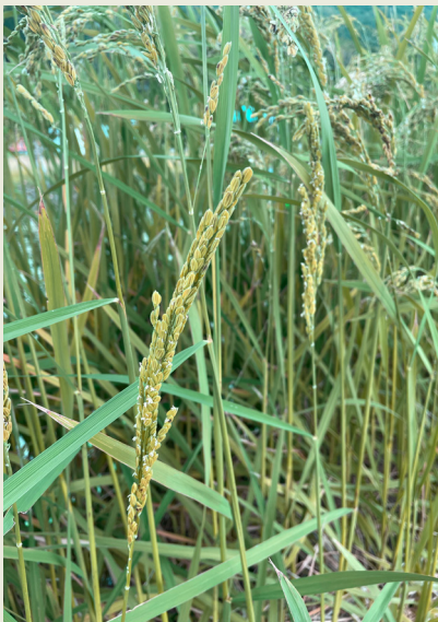
9 月下旬開始孕穗開花