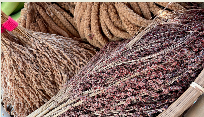
祭儀中的傳統作物