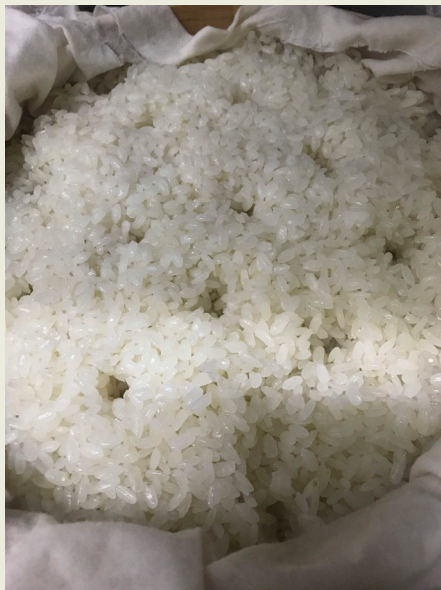
蒸熟的糯米飯，就是 hakhak。

不論是 hakhak 還是 toron，都是家人和親友團聚時製作的美食，不僅需要大家的協力，也是一個加深彼此感情的好時機。單純的好滋味中，更融入族人濃厚的情感。