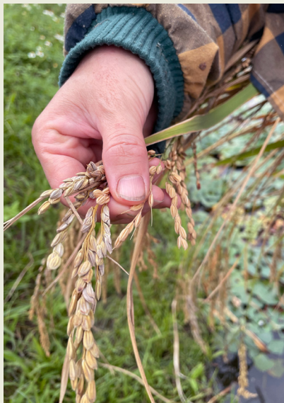
已經飽滿可以收割的 falinono