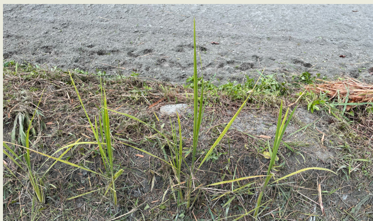
邦查農場旱作的 falinono，6 月育苗，7 月種植於農場田邊。

以往 falinono 是在山上旱作的作物，具耐旱的特性。水稻種植方式引入之後，目前在光復地區的族人會在初期生長時提供較多水源，後期則根據環境自然生長；太巴塢及砂朥越部落仍在種植的耆老，於田間採先水耕後旱作的管理方式。2023 在新社耕作的宮宮，採用水稻種植的方式，來種植 falinono，植株長得比旱作的 falinono 高大許多。在光復馬太鞍保種的蘇秀蓮，採用旱作的方式來復育 falinono，不同的條件，生長出的稻穗也不盡相同。