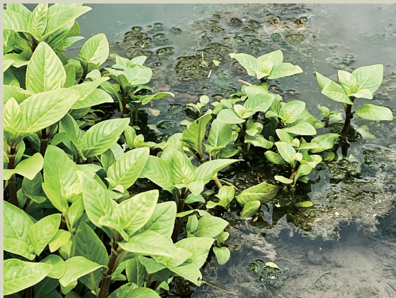
// 大葉田香，是不管哪個部落，釀酒時都一定使用到的植物

在找回酒麴的過程中，協會發現部落老人家在沒有種植之後，跟著也忘了到底是用了哪幾種的植物？大家都只記得有大田葉香，但傳統上究竟是用了哪幾種？那就無法確定了。