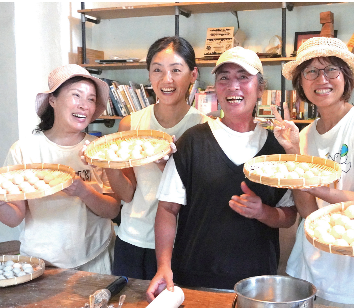
// 舒米 (左三) 致力於推廣傳統釀酒，也想將技術傳達給更多人