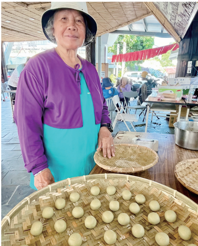
// 為了恢復釀酒技藝，貓公部落找 8 位釀酒師，來傳承技藝