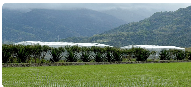
▲ 本場試驗 2 種形式的簡易型設施，都能抵抗強風豪雨保護芒果花期授粉昆蟲的活動力，農友可自行參考應用

本場農機研究室簡宏諭約僱助理則說明，簡易設施大小主要取決於塑膠布或農膜布寬度，長度則可自行決定，但仍要考慮中間支撐鋼管的乘載效能。以每日 4 人施作計算，強固型為 6 日、一般型為 5 日即可完成。另外考慮積水問題，因此建議建置山形設施、頂棚斜度要夠，並且在適當位置以鐵釘打洞排水。