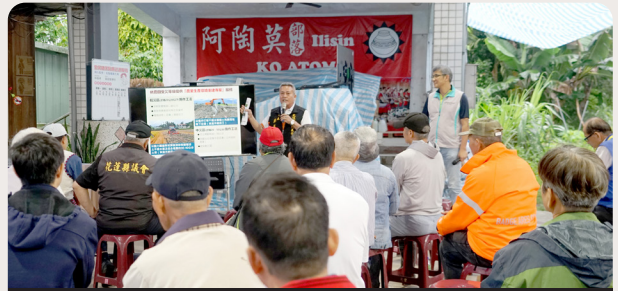
▲ 光復光豐農會及阿陶莫部落二個場次，都邀請族語老師翻譯專案內容，確保族人訊息不漏接

值得注意的是，本專案僅限「一般受災農地」。若已被林保署列為徵收、造林範圍的「重災區」，或屬於「河川治理用地」範圍內之土地，則不在本專案受理範圍內。同時不接受個別化要求，包括肥料、綠肥等品項由廠商統一規劃，無法針對個別地主需求調整。另外專案採「就地改良、土方不外運」原則，不提供淤泥外運服務，亦不受理自費處理後的現金補貼申請。