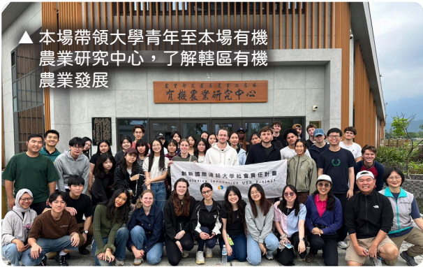
▲本場帶領大學青年至本場有機農業研究中心，了解轄區有機農業發展