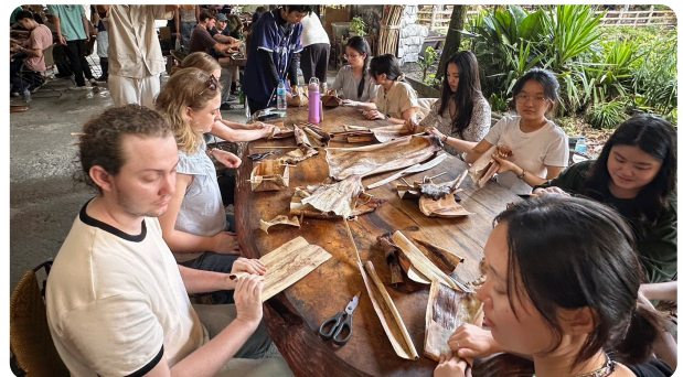
▲本場帶領大學青年深入光復鄉阿美族部落，至紅瓦屋製作檳榔葉鞘食器

在政大的梯次中，工作坊帶領 11 個國家的青年，前往有機農業研究中心參訪。大家不僅認識臺灣有機農業的發展與產業特色，更直接面對面，針對各國推動有機農業時遭遇的困境與解方進行深度探討。透過不同國家的經驗交換，激盪出非常豐富的創新思維。