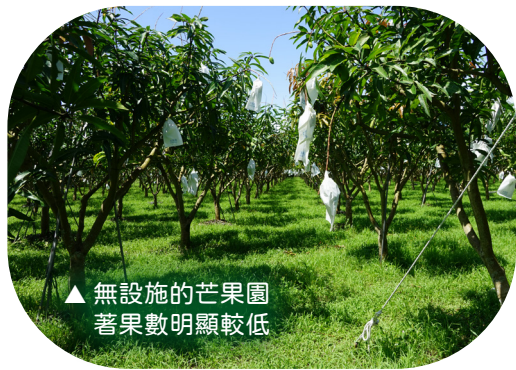
▲ 無設施的芒果園 著果數明顯較低