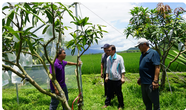
▲ 設施入口的芒果樹，可明顯看出靠內側部分結實累累，外側因為無著果，農友已將枝條剪除

本場楊大吉場長表示近年極端氣候影響農作物生產，因此特別指示場內研究同仁輔導農友更多應對方法。目前已證實簡易設施對芒果著果有正面助益，但在實際操作上，例如塑膠布鋪設及移除、噴藥車進出設施等，都還有更多進步空間。未來本場會一步步帶領農友紮根花蓮的芒果果樹產業。