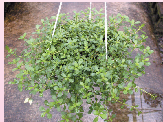
▲過江藤用途：吊盆、高腳盆、地被景觀