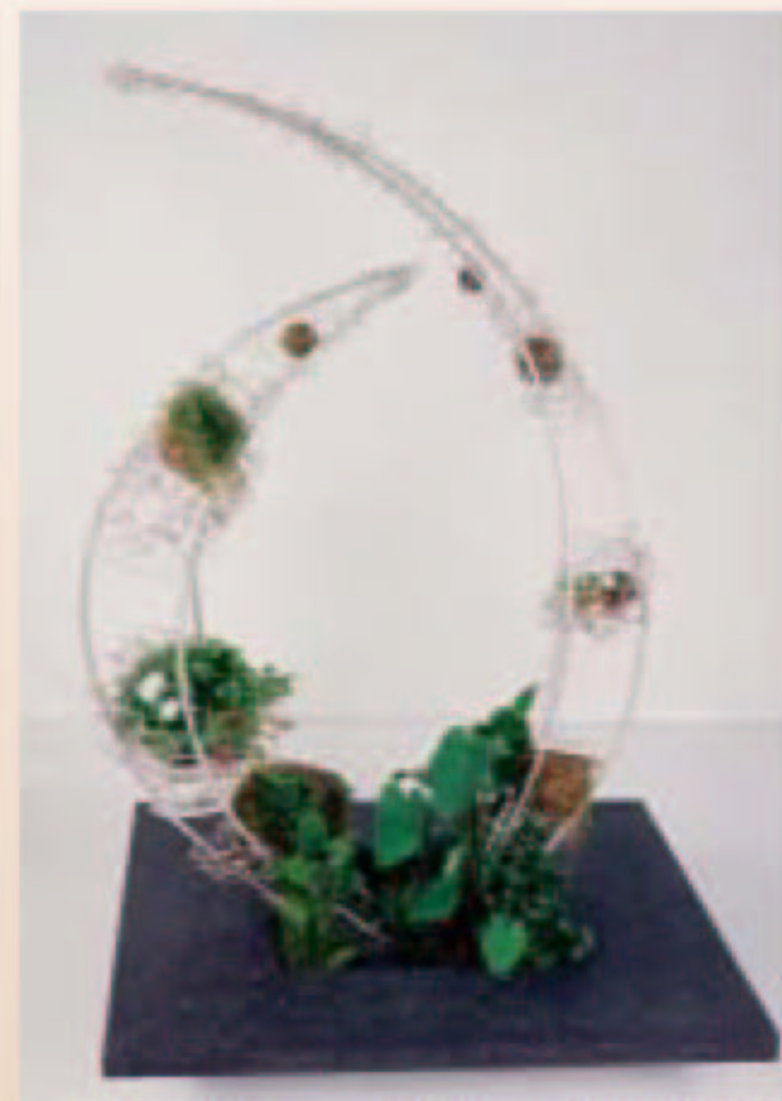
▲沈襄君以兩層水草景觀造型榮獲第一 名(指定作品)