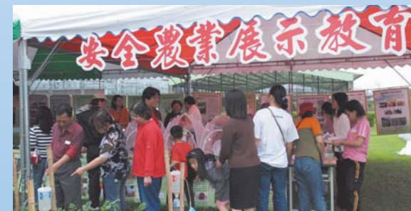
▲加強推動及輔導產銷班落實「安全農業」是本場首要工作目標

農委會正積極研擬有機農業及類似日本「JAS法」之立法，以利全面實施，並於推動示範計畫初具規模後，建請行政院整合衛生署、消費者保護委員會等食品衛生與消費者保護相關部會，俾達成消費者保護與落實「安全農業」目標。（行政院農業委員會94.03.02農業新聞資料）