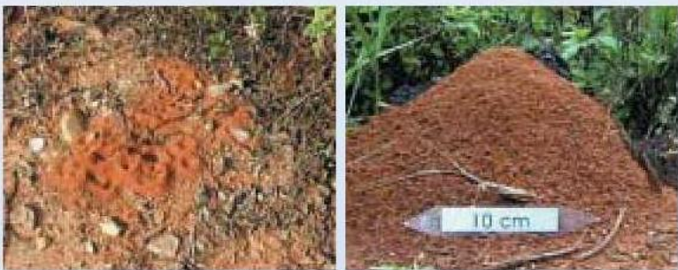
▲入侵紅火蟻蟻丘，初期蟻巢(左)，成熟蟻巢有明顯隆起的蟻丘(右)

入侵紅火蟻為完全地棲型蟻巢的螞蟻種類，成熟蟻巢會以土壤堆出高約10~30公分直徑約30~50公分的蟻丘，但新形成蟻巢約在4~9個月後才會成熟而出現明顯小土丘狀的蟻丘，是快速確認入侵紅火蟻的方法之一；目前台灣約270種螞蟻中，皆不會築出高於地面10公分以上的蟻丘，因此可為判定的依據。但未成熟前的蟻丘並不明顯，不易與其他種螞蟻的蟻巢區別，民眾需提高警覺。