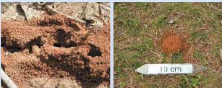
▲其他螞蟻成熟蟻巢

由於紅火蟻有保護巢穴的特性，一旦蟻巢受到碰觸，便會傾巢而出攻擊敵人，在野外發現蟻巢時，不宜干擾蟻穴。屋外有草皮者須注意防範紅火蟻入侵，在庭院或其他戶外區域可以使用含有合成除蟲菊或其他有效成分的噴霧劑