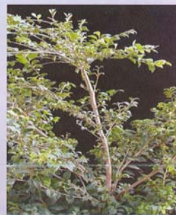
蚊母樹 用途：中小品盆栽、景觀造園