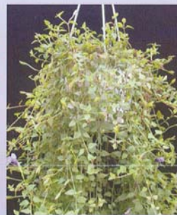
倒地蜈蚣 用途：中小品盆花、吊盆、景觀地被