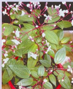
金石榴 用途：小品盆栽、盆花、景觀造園