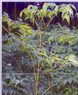
山菜豆 用途：中小品盆栽、景觀造園