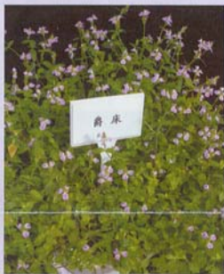
爵床 用途：中小品盆花、吊盆、景觀造園