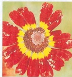
西方花薊馬的為害徵狀較一般薊馬更為明顯