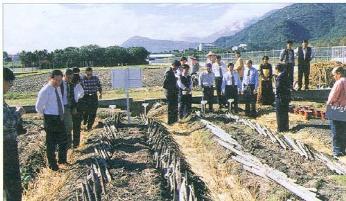
↑侯場長向審查委員介紹花蓮三號山藥之特性