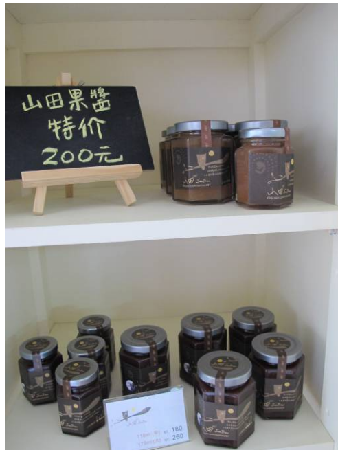
左上：遠古農莊 右上：小島學堂 木作 左下：璞石咖啡館烘焙有機咖啡豆 右下：山田 27 手公果醬