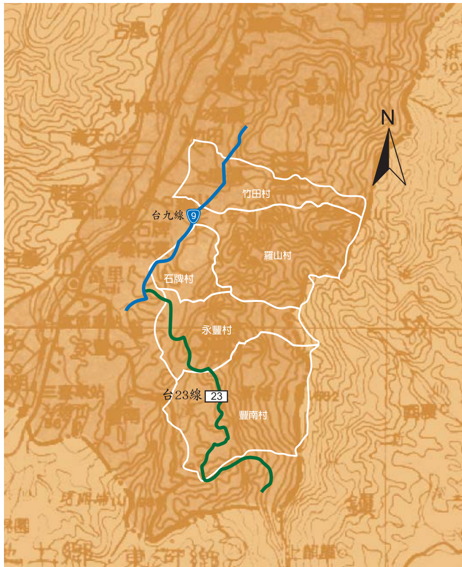
羅山有機村產業群聚發展計畫，涵蓋區域之各農村座落圖及主要交通路線。