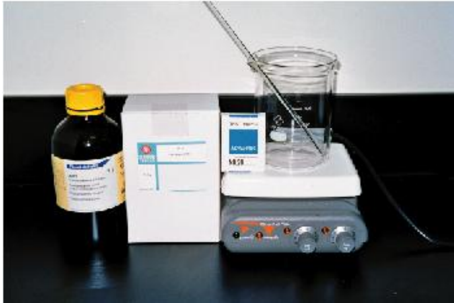
自製文旦精油殺菌乾洗手的材料