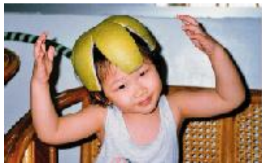
食用後的文旦柚還可以當瓜皮帽