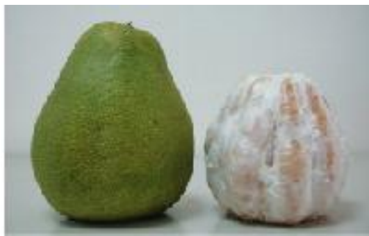
鮮美多汁的文旦柚

每逢中秋節前後，家家戶戶都會食用許多文旦，而文旦的果皮除了拿來當柚皮帽外似乎沒有其他的用途，這是非常可惜的事。如今我們可以利用簡單的工具將文旦精油萃取出來，並製成殺菌乾洗手及手工香皂等清潔用品，一方面可作為日常生活清潔之用，另一方面則可減少垃圾，可謂一舉多得。下面就針對幾種簡單的文旦精油DIY之做法加以說明。