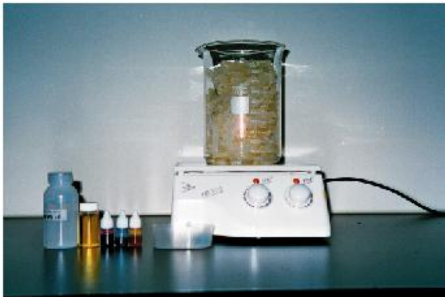
自製文旦精油手工香皂的材料

註：最好事先在模型上塗上一層薄薄的沙拉油，以方便肥皂完成後之脫膜。透明皂塊可至一般手工材料行或化工原料行購買，如果要自製亦不難，可用油脂加上氫氧化鈉加熱即可製成皂塊。