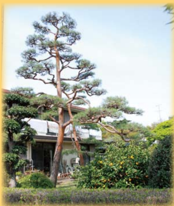
▲大宮盆栽村之行道樹及庭園木均有濃濃的盆栽味

及芙蓉園，就在一園看過一園的路途中，發覺整個盆栽村的路樹及庭木都經過專業手法的修整，因此也都帶著濃濃的盆景味道，從這上面也可看到日民族對文化之守護與執著是很徹底而深植於日常生活之中。村子裡的盆栽名園都是家族代代相傳而歷史悠久的，因此百年以上的老盆景可以”比比皆是”來形容而不為過，然而在現代要守護傳統也有其必然的壓力，速食時代的日本年輕人對傳統事物越來越是一知