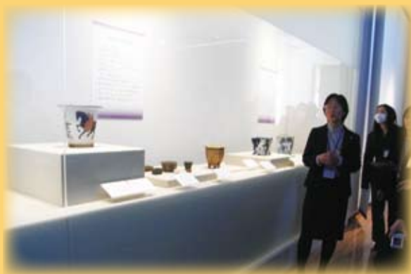
▲大宮盆栽美術館之室內展覽區