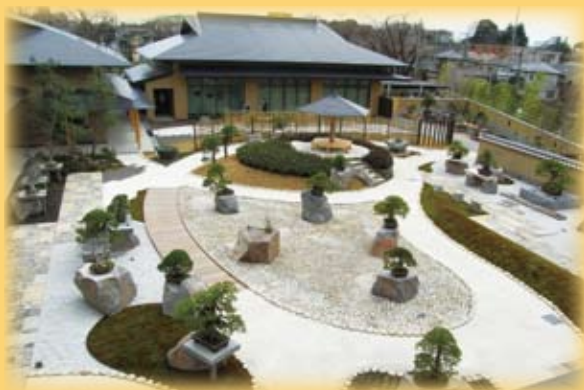
▲大宮盆栽美術館之戶外展覽區

盆栽產業之參訪行程安排於4月19日，日本之盆栽（Bonsai）亦即我們俗稱為盆景的傳統園藝，此行主要參訪位於日本東京附近著名的盆栽重鎮大宮盆栽村及大宮盆栽美術館，正確位置為埼玉縣的大宮市盆栽町。當天上午先行參觀大宮盆栽美術館，當時由台灣長宿協會