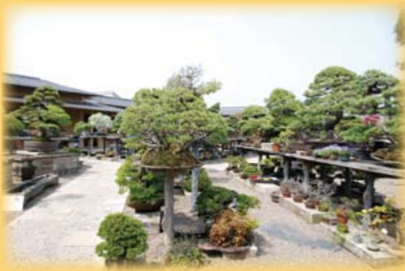
▲蔓青園之盆栽庭園景觀

半解，對蒼勁古樸而沉重昂貴的盆栽則止於欣賞而無力購買也無力照顧，此次參訪中已看到走出陳舊老園而積極向外推廣的行動，更以輕便活潑及花彩組合的型態來吸引年輕的客群，展現出活化這個傳統的技藝與產業的作為，譬如蔓青園就進行一年半的休園重新設計規劃與改裝，於2010年二月開園再出發，很明顯的在古老盆栽的基礎外增加許多展示、教育及DIY的功能。