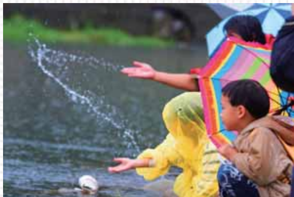
↑ O'rip舉辦生活美學小旅行