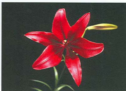
台灣百合與亞洲型百合(Prominence品種)雜交後產生之後裔植株，不同植株間，花形與花色各異