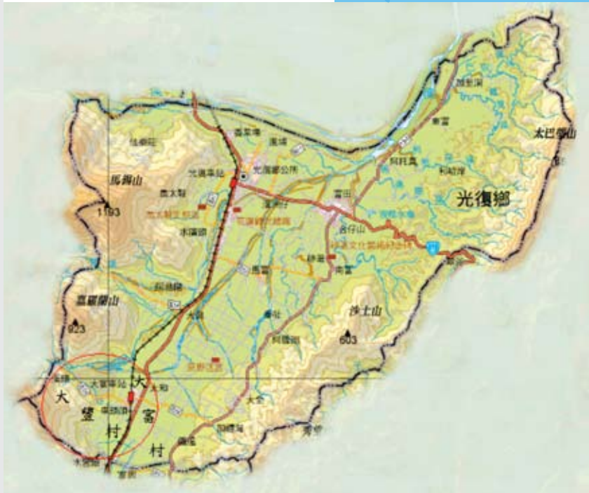
▲光復鄉大豐大富社區位置圖