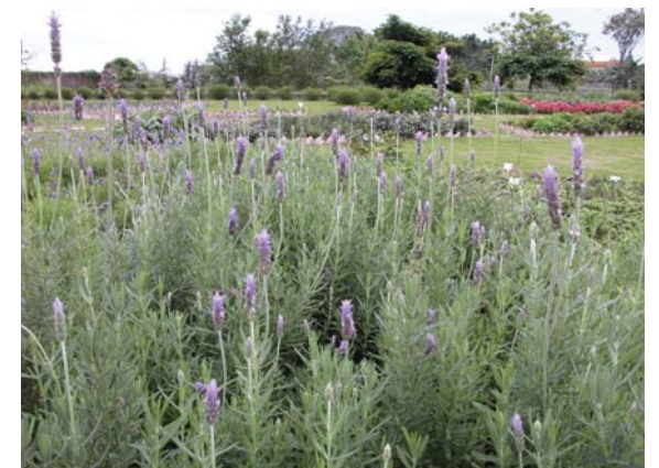
花蓮區農業改良場內充滿生機野趣的香草園景觀