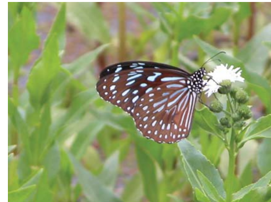
黑脈樺斑蝶(雄)吸食光冠水菊花蜜