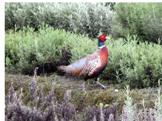
環頸雉(雄)在薰衣草園裡昂首闊步地巡視