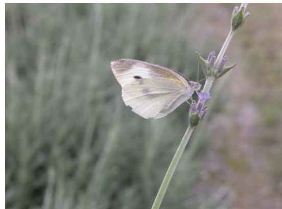
白粉蝶與甜薰衣草