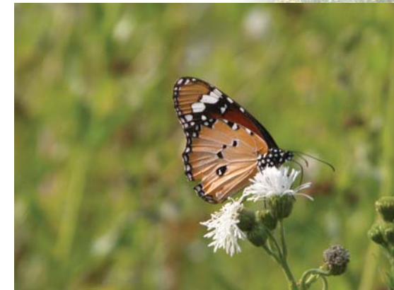
淡紋青斑蝶(雄)吸食光冠水菊花蜜