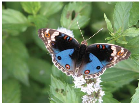
色彩鮮麗的孔雀青蛺蝶(雄)正吸食薄荷花蜜