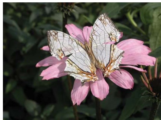
外型古怪的石牆蝶棲息在紫錐花上