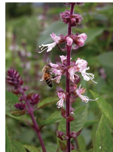
蜜蜂正忙著採食羅勒(左)和羽葉薰衣草(右)的花蜜