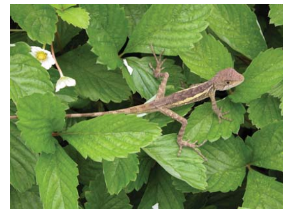
攀木蜥蜴一臉惶恐地爬行在野草莓的葉子上