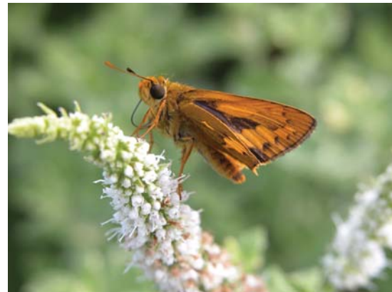
弄蝶吸食薄荷花蜜