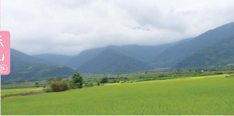
↑ 眺望遠方的中央山脈和近處的翠綠稻浪，讓人的心情跟著沉澱下來。