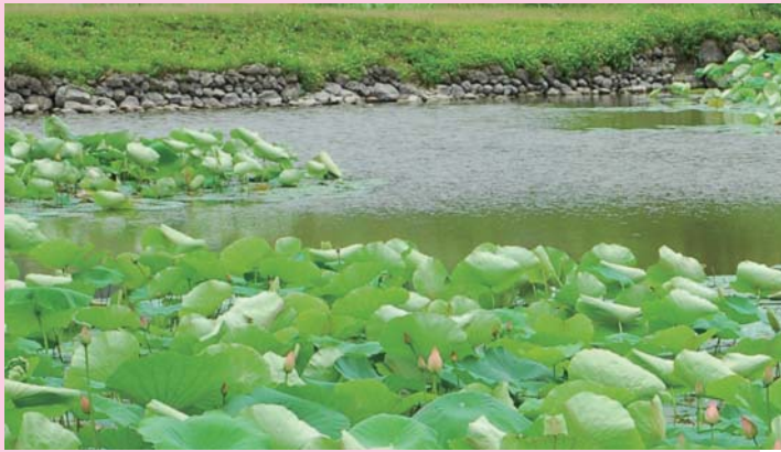
↑ 心蓮蕊荷園的荷田美景

「心蓮蕊荷園」坐落於富里鄉農會羅山展售中心對面，在省道台九線的另一側。來到這裡，很少有人不被眼前大片美麗的荷塘風景所吸引—粉色荷花含苞待放，涼風送來陣陣幽香，放眼望去，遠方青山點點，近處荷葉田田，景色清幽，讓人還沒住下來，就已經捨不得走了。