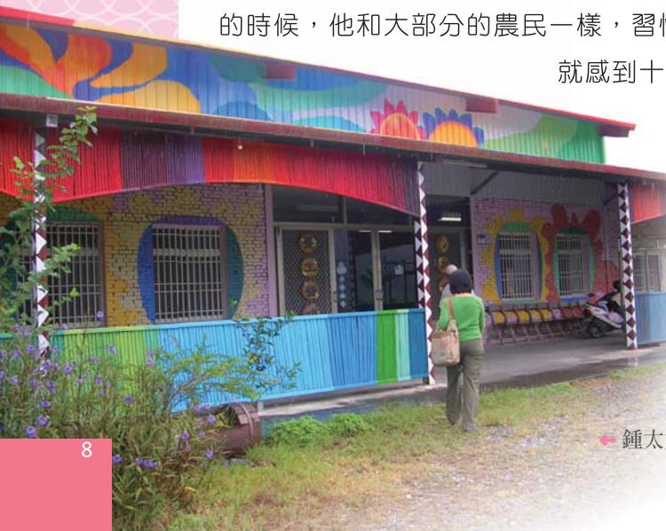
← 鍾太太開設的「羅山田媽媽有機養生坊」

除了荷花大餐，鍾先生最自豪的，還是自己種植的有機米。鍾先生說，年輕的時候，他和大部分的農民一樣，習慣使用農藥來抑制蟲害，但每次噴藥，身體就感到十分不舒服，常常得到醫院掛病號。所以當花蓮農改場在羅山推動有機栽培時，他傾全力支持，停用農藥以後，果然田間環境變好了，稻田裡總是有許多野鳥飛來飛去，他也樂得和鳥兒作伴。細心種植出來的有機米口感絕佳，目前除了賣給農會，也供應太太的餐廳使用，不惜成本，就是希望遊客吃得安心又健康。