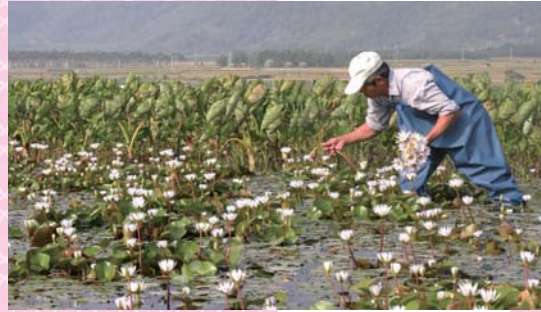
羅山可採蓮，蓮葉何田田