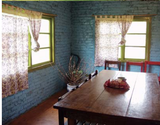
↑色彩鮮豔的房屋外牆