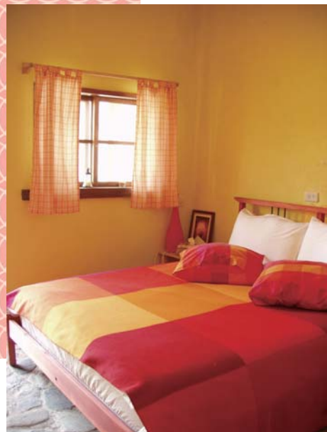
↑美感十足的房間設計