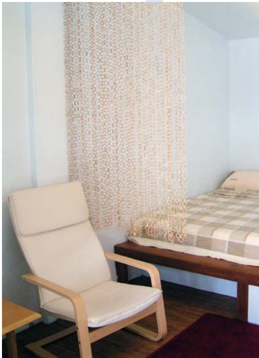
↑明亮素淨的四人雅房