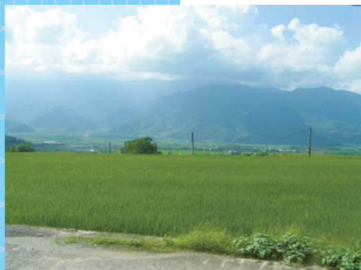
前院可遠眺中央山脈美景