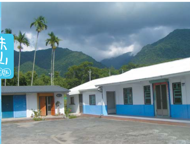
↑寬闊的院子極適合夜晚觀星