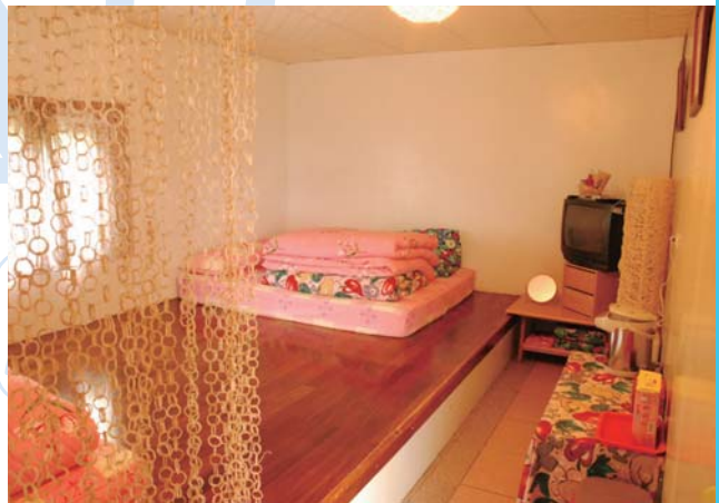
↑佈置溫馨的八人雅房