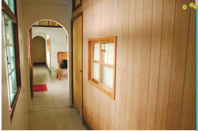
↑木造房子，帶著濃濃的古早味