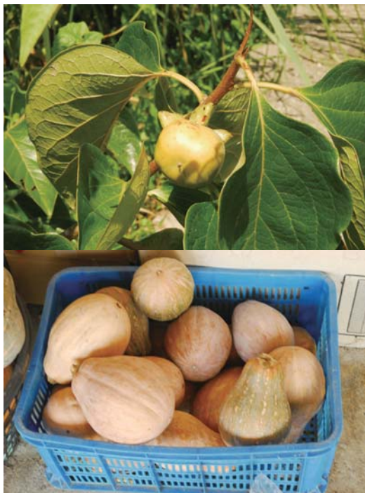
↑園子裡剛結果的柿子

著採擷芒草，用來製作掃帚，綁製芒草掃帚看似容易，實則需要許多技術，必須先處理芒花的細屑，再將分枝一一收理整齊，綁紮成束，沒有幾十年的老經驗，絕對做不來這麼細膩的功夫。以芒草製作成的掃帚，質地極為輕柔耐用，不會刮傷昂貴的地板，而且只要妥善保存，使用10年以上也不會損壞，既輕便又環保，遊客來到羅山，別忘了這項稀有又實用的伴手禮喔！