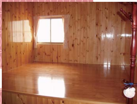
↑明亮寬敞的房間，可以一次擠很多人