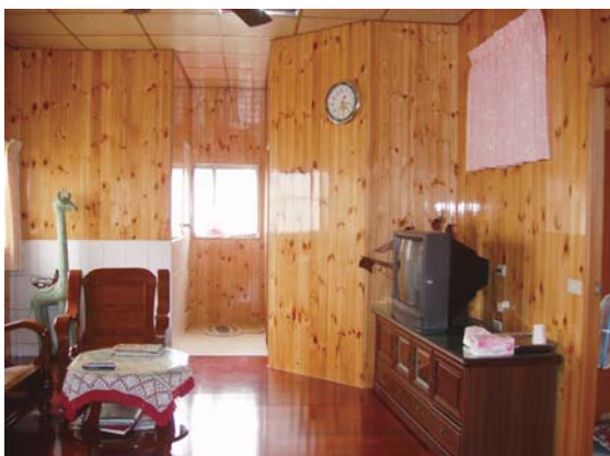
↓窗明几淨的二樓客廳