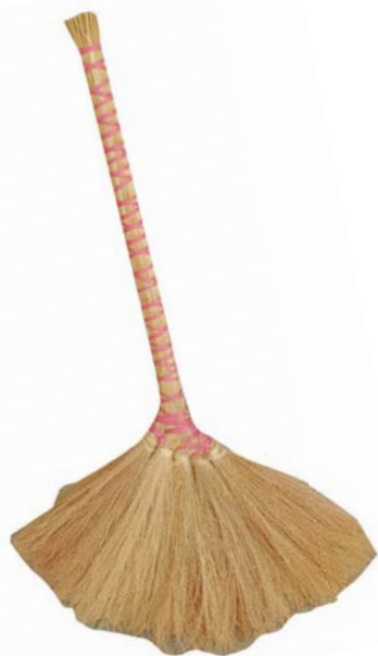
↑邱伯伯巧手綁製的芒草掃帚，美觀輕巧又耐用