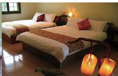
↓房間內部陳設典雅素淨