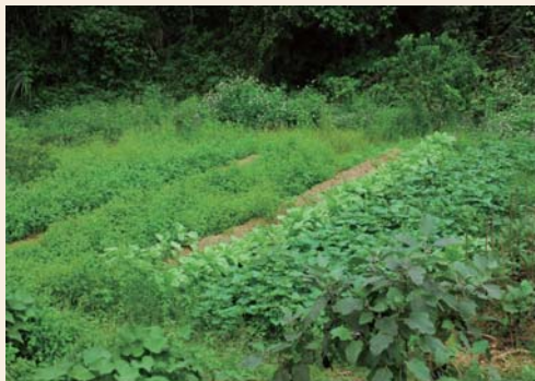
↑綠油油的有機菜園

數年前，林伯伯與林媽媽配合農會計畫，整理家中空房，開始了體驗農家的副業經營。原本只是想著這麼做可以貼補些家用，沒想到，兩位老人家待客真誠，讓遊客感動不已，常常住過一次就變成常客，每年固定回來羅山探望他們，年邁的日子裡多了許多好友陪伴，卻是當初意想不到的收穫。而讓二老感到更欣