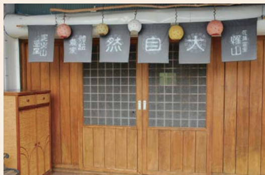
↑古樸的木造房門，是「大自然體驗農家」的註冊商標