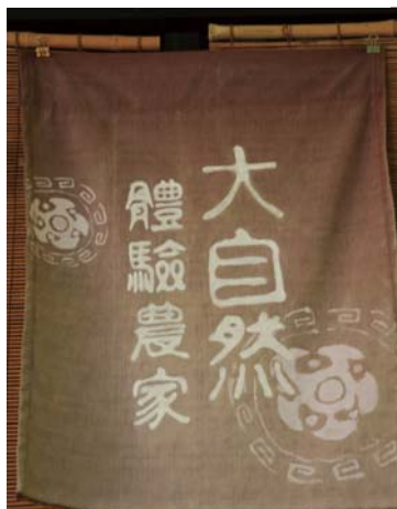
↑日本風的布簾招牌