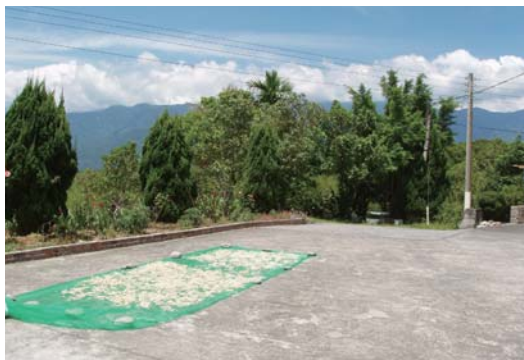
↓寬敞的院子，可以曬穀、曬蔬菜。