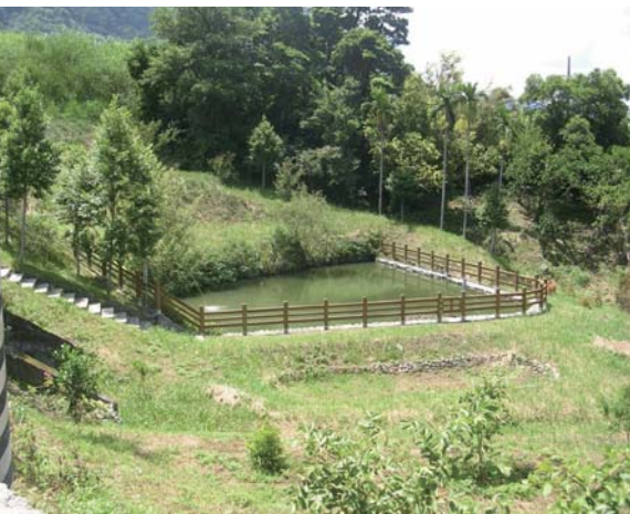
↑林伯伯的魚池—用純淨山泉水養出來的魚，一點土味也沒有。