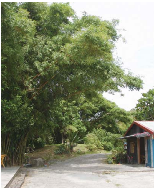
↑翠綠的竹叢是玉竹軒的註冊商標