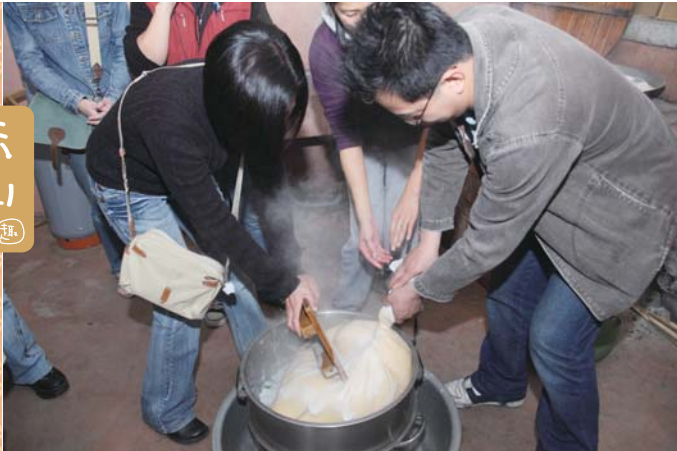
↑遊客參與泥火山豆腐DIY