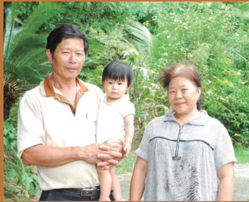
↑ 溫伯伯、溫媽媽，還有可愛的小孫女