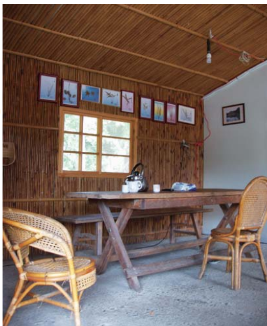
↓溫伯伯親手蓋的小竹屋，冬暖夏涼，是遊客泡茶聊天的好地方