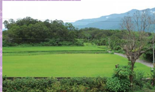
↑前院可眺望稻田美景