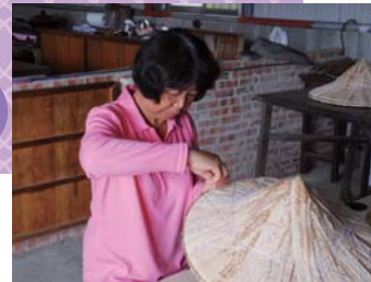
↓正在專心編斗笠的溫太太