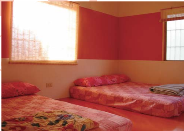
↑房間的色調溫暖柔和