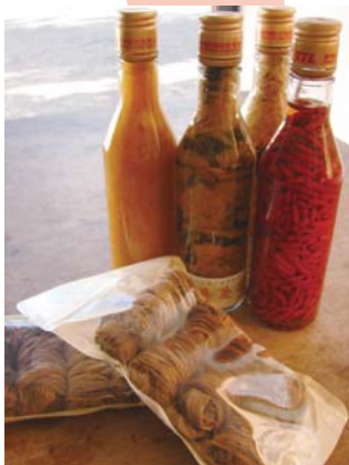
↑自製的福菜、橘子醬、辣椒、梅乾菜等農家伴手禮