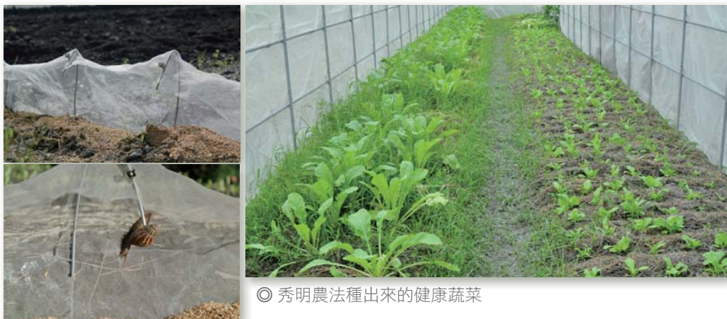
◎ 秀明農法種出來的健康蔬菜