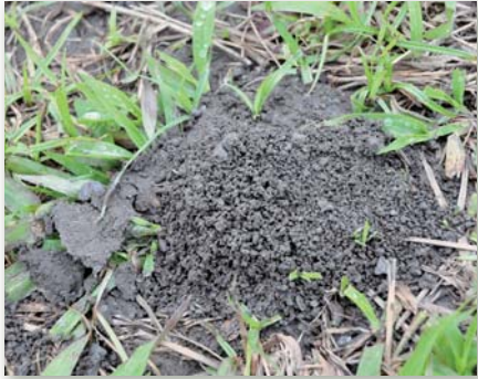
◎ 滿圓的蚯蚓便便，是土壤肥沃的證明

柳丁滋味更濃郁，口感也更柔嫩多汁。五月時，果園也出產熱帶水蜜桃（俗稱甜桃），甜桃氣味如水蜜桃一樣香甜，但口感更為爽脆，由於採取有機栽種，連營養豐富的外皮也能安心食用。🍑