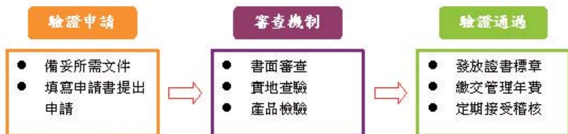
圖二：有機驗證流程簡示圖

另外，依據102年「調整耕作制度活化農地計畫」之規定，合於該計畫認定基準之農地，除了轉（契）作補貼與一期休耕給付