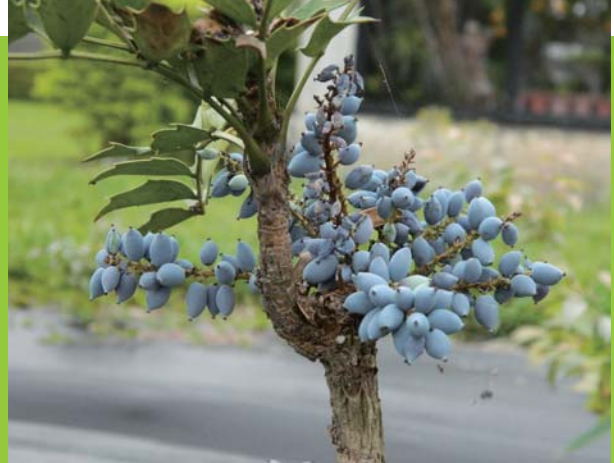
▶ 阿里山十大功勞的漿果，鳥類喜愛啄食。