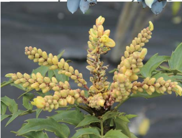
阿里山十大功勞的花為黃色