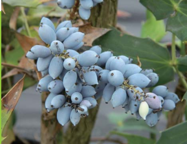
▶ 阿里山十大功勞的漿果成熟時變成藍黑色