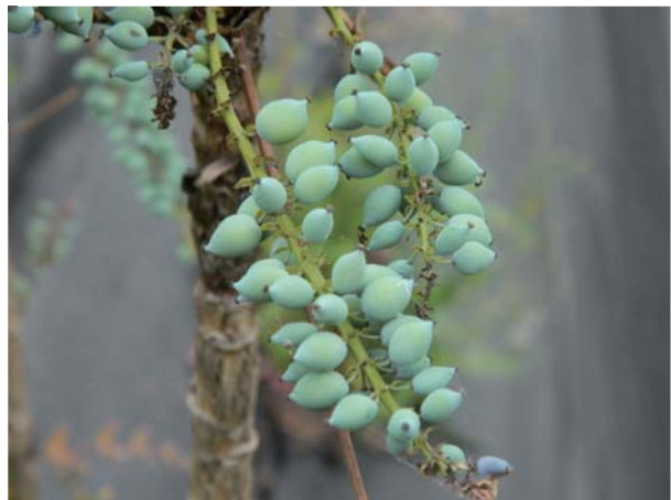
阿里山十大功勞剛結果時為綠色