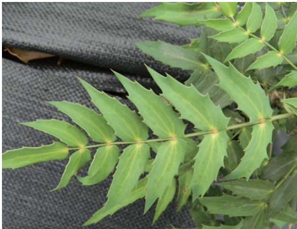
▶ 阿里山十大功勞的葉緣為疏鋸齒針尖形態