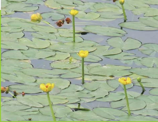
臺灣萍蓬草的葉片漂浮在水面