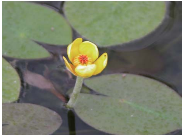
臺灣萍蓬草的黃色花萼常被誤認為花瓣。