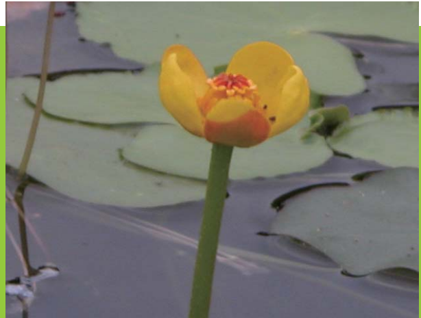
臺灣萍蓬草的花梗長，將花器托出水面。