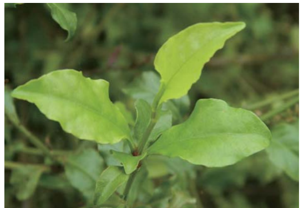
白花藤的葉片卵形至長橢圓形