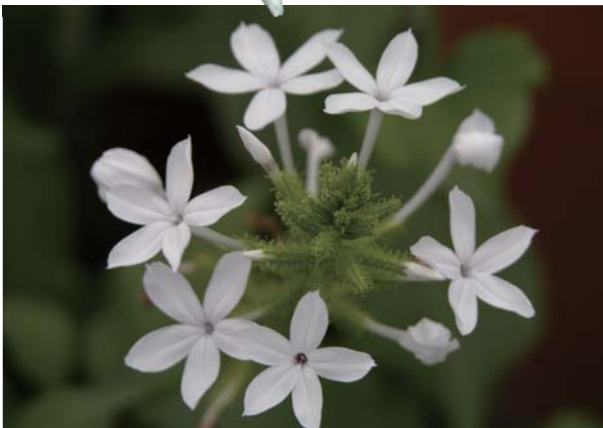
白花藤的花器形態