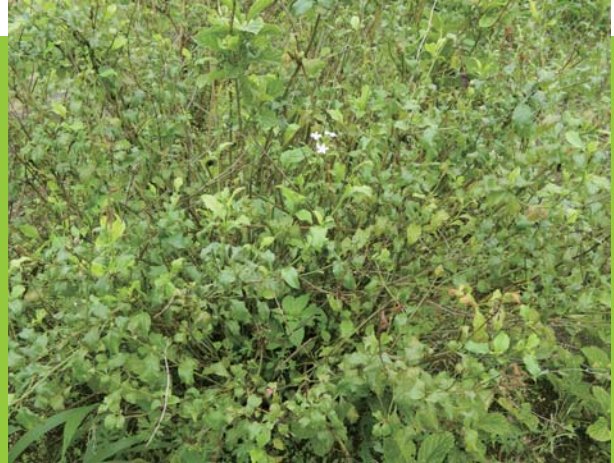
白花藤茂密叢生，已馴化自生。