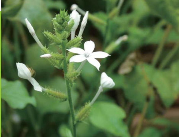
授粉後的蒴果因外披腺毛，可黏附在動物身上，來傳播種子。