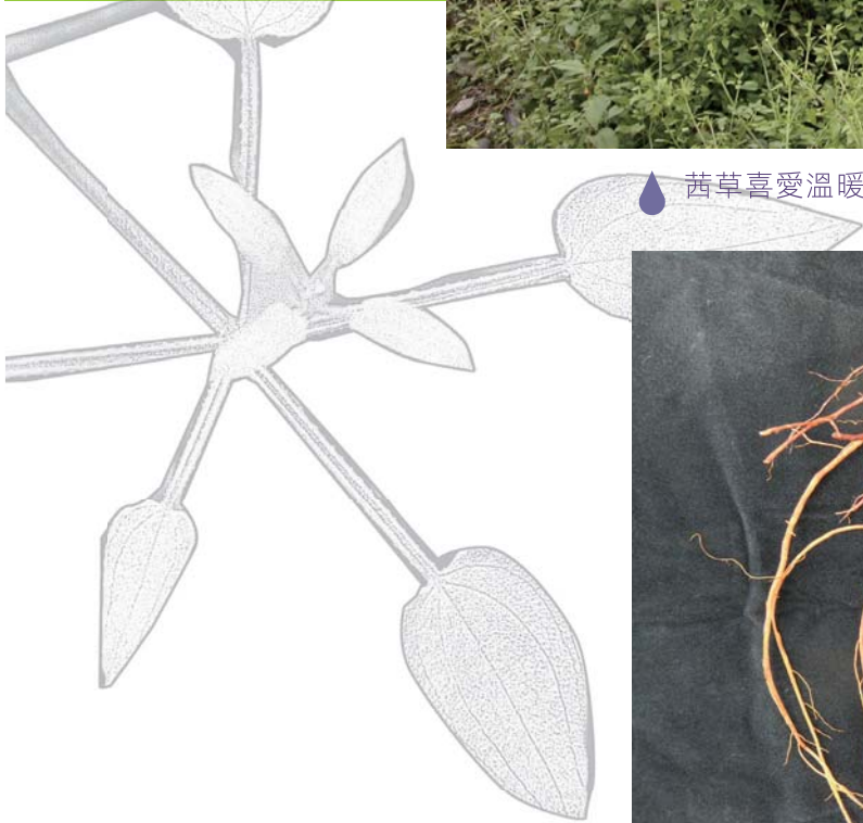
❖ 茜草喜愛溫暖潮濕地，易茂密生長形成覆蓋。