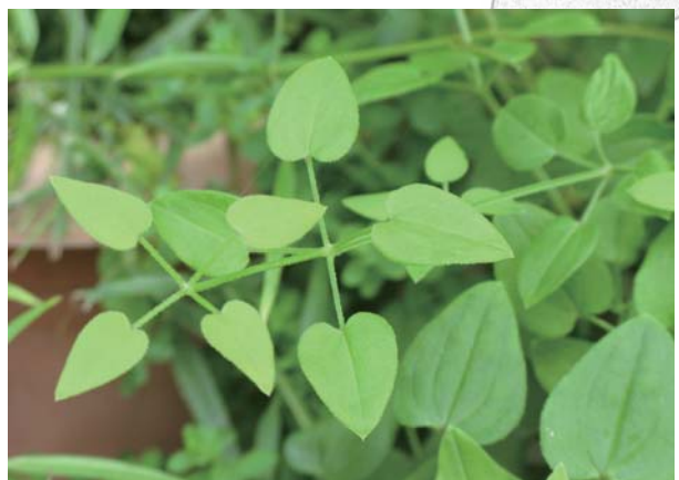
茜草的葉片是四片輪生，也被稱為四輪草。