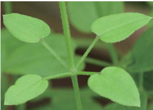
葉柄、葉緣、背脈都有細鈎刺。

備註：莖節隨處生根，根皮中含色素，老根色素特別多。因根部具紅色色素，所以也被稱為「紅藤仔草」、「紅根仔草」，全株具有鈎刺，故能輕易的攀附於其他物體上，甚至形成覆蓋。