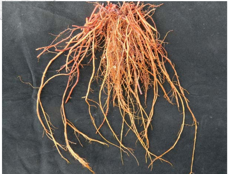
❖ 茜草的根為長圓柱形，根外表皮赤黃或赤褐色。