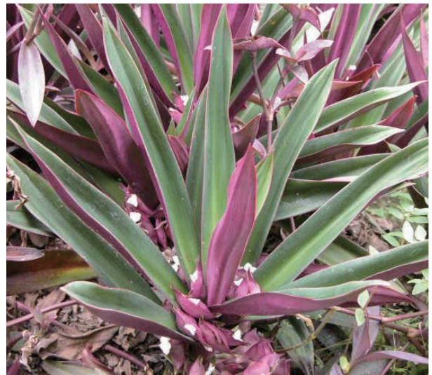
🔹 蚌蘭的花聚生在莖基部