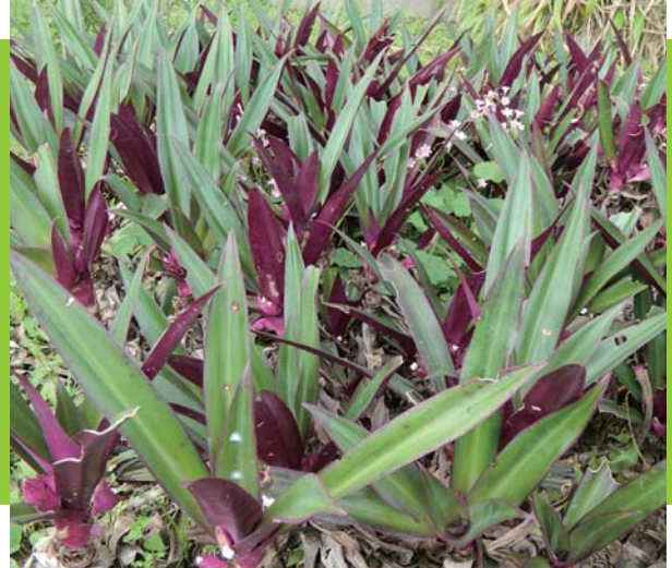
🔹 蚌蘭常作為景觀綠化植物