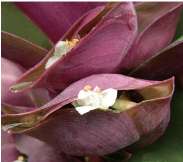
🔹 蚌蘭的紫色苞片似蚌殼，故名蚌蘭。