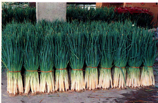
蘭陽一號清洗後外觀