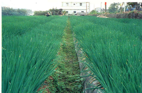
蘭陽一號田間生育情形

蘭陽一號於民國74年由宜蘭地方栽培品系中單株選拔獲得，原品系代號為「83-C-1-3-1」，歷經品系觀察、品系比較試驗、初級試驗、高級試驗、肥料試驗、種植密度試驗、區域試驗、主要病蟲害藥劑防治效果試驗以及成份分析，同功異構酵素分析等，表現優異，於83年2月25日經審查通過，正式命名為「蘭陽一號」，商業名稱為「青玉」。本品系產量高、蔥白較長且潔淨、需肥料量低，可降低生產成本。植株直立適合密植、較耐高溫環境且性喜潮濕，適合宜蘭縣、台北縣及桃園縣等本省北部多雨地區週年種植。經地方試作結果，甚獲蔥農好評，栽培面積可望迅速增加。