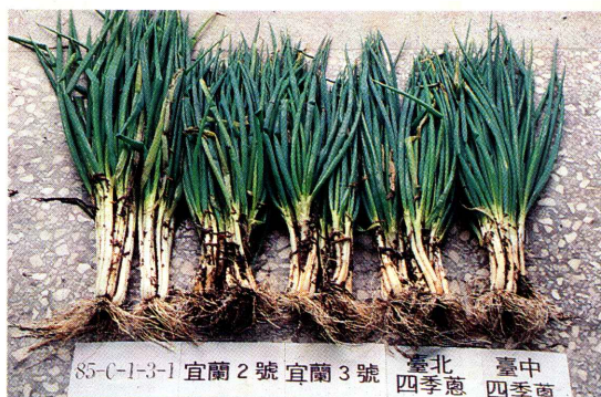
蘭陽一號(85-C-1-3-1)與舊有品系植株外觀比較