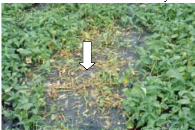
圖二、蕹菜受青枯病菌感染，植株呈現枯死現象