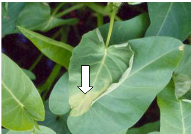
圖一、蕹菜受青枯病菌感染，葉部呈現萎凋現象