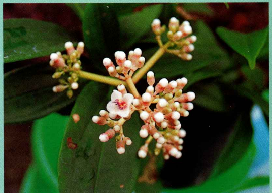
玉牡丹之開花情形