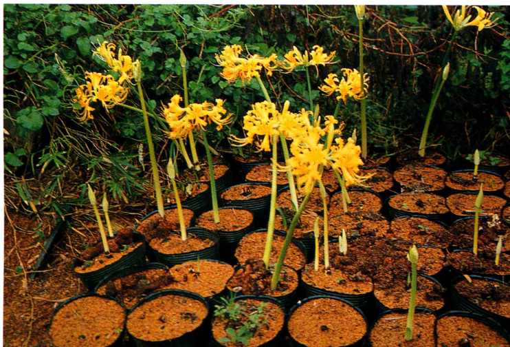
▼ 在蘇澳鎮無尾港以有機栽培金花石蒜盆花情形。

我們很多資源，這些應該永續地留給子孫的。如中藥材海芙蓉、植梧樹、山藥等，或天然農藥的苦楝等，這些作物在東海岸都有不錯的生長表現，只待我們去發掘它，並發揚光大。