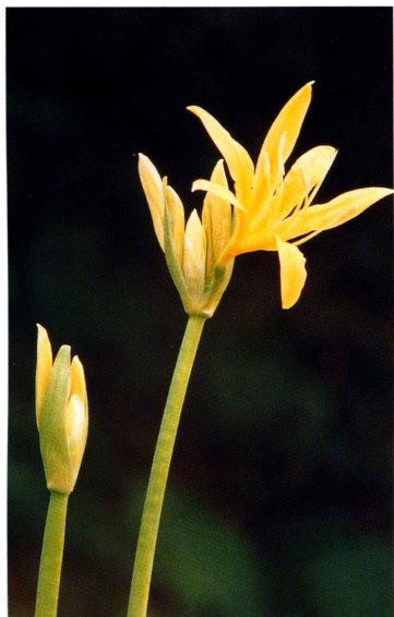
▲金花石蒜花軸實心，長約60公分，花5-10朵，輪生開於花軸頂端。