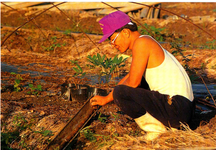
◀ 老天賜給我們很多資源，如山藥、海芙蓉……等，這些應該復育並永續保留給下一代。