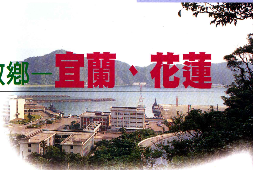
▲ 好山好水的宜蘭縣蘇澳鎮是金花石蒜的故鄉。