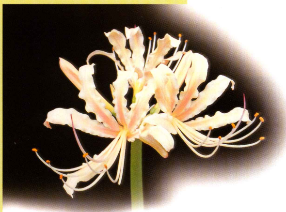
▲金花石蒜與紅花石蒜雜交所育出的雜交一代新品系。