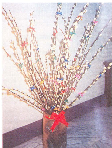
銀柳台語叫「銀兩」代表吉祥是春節期間上等插花材料。

銀柳屬於楊柳科，原產中國、日本等地，為多年生落葉灌木，因花穗形狀有如貓尾一般，故又稱為貓柳，銀柳台語與銀兩同音，代表吉祥之意。由於銀柳的主要觀賞期正逢農曆春節，脫掉紅褐色的苞片，再繫上紅色的絲帶後，常為春節帶來喜氣。目前大多利用於切枝瓶插，是春節期間上等插花材料，頗受家庭主婦所喜愛。其產品除供應國內市場需求外，並銷往新加坡、香港市場，也試銷日本、韓國等有華人居住的地方，具有發展潛力。銀柳性喜潮濕的氣候，甚適合蘭陽地區種植，大多利用稻田轉作區栽培，已成為本地區重要之花卉作物，過去栽培面積曾