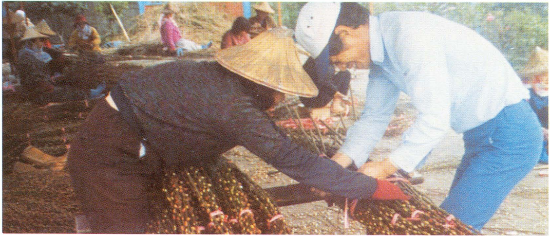
銀柳採收後分級包裝作業。