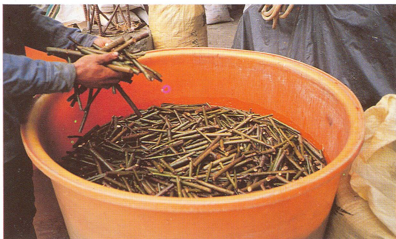
用免賴得1000倍液浸泡消毒後插植。