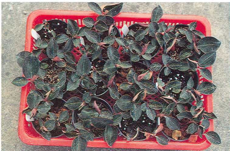
瓶苗移植馴化成活後生育旺盛