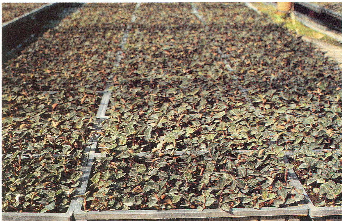
金線連大面積栽培的情形（埔里）