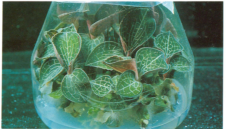
不定芽體轉移到發根培養基上2~3個月後長成健壯植株，可出瓶定植

由於金線連一年才開一次花，無菌種苗的獲得又非常不容易，所以通常都不直接拿出瓶來種植，而是當作培養母瓶，作為更新種苗之用。它的做法是把長到3-5公分高的苗切成一段一段，每一段含有一個節，再將節段放在增殖培養基上培養，每一個節上又會長出2-7個不定芽，經二~三個月後這些芽又長大，可以再切成節段去培養，如此一來繁殖的