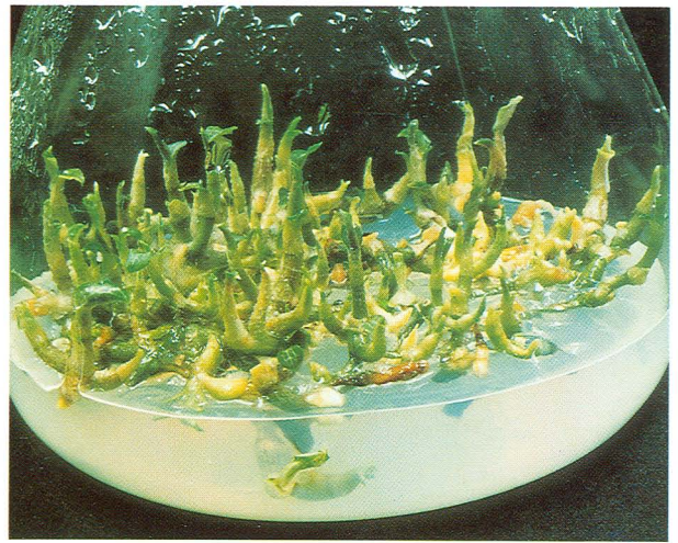
節段培養一個月後，長出叢生狀不定芽

作箱中剖開，把種子均勻地撒在洋菜培養基上。大約經過一個月後種子開始發芽，再經過二個月後長成一個個長約1~2公分，白色無葉片的條狀物，這是它的莖部，這時整個培養瓶已經長滿了，空間太小必須換瓶作繼代培養。繼代培養所用的培養基以全量MS為基礎，再添加有機物質效果更佳，如酪蛋白水解物 (Casein hydrolysate 500ppm)。如此前後經過8個月左右，金線連瓶苗長到約5公分高，可移出瓶來種植。