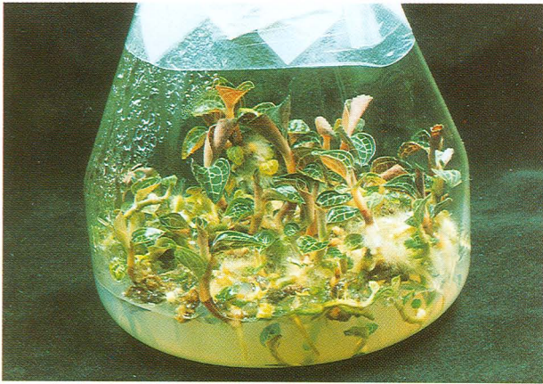
無菌種苗繼代培養於含酪蛋白水解物的MS培養基上三個月後長成植株，可以出瓶定植或作為母瓶