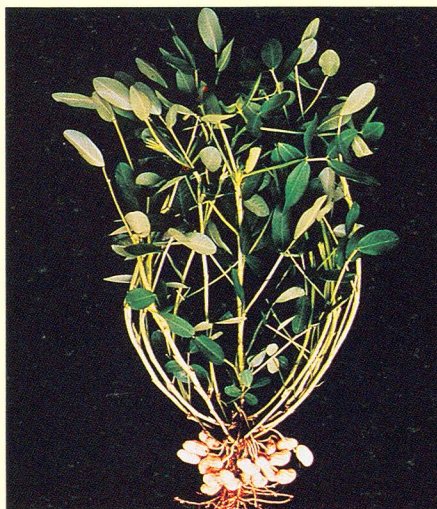
◁ 花蓮一號植株直立，莢果著生位置集中在莖基部。

落花生種植在石灰質含量高的鹼性土壤，由於鐵的利用效率低，易造成落花生葉部黃化的發生，花蓮 1 號平均葉部黃化等級春作為 0.9 級，秋作為 0.4 級，明顯較台南選 9 號耐葉部黃化的發生。