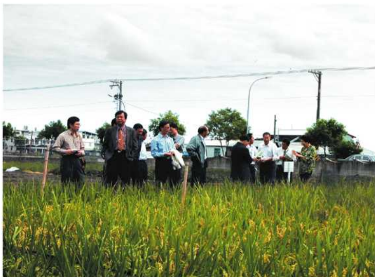
▲花蓮19號申請命名，委員於田間審查情形