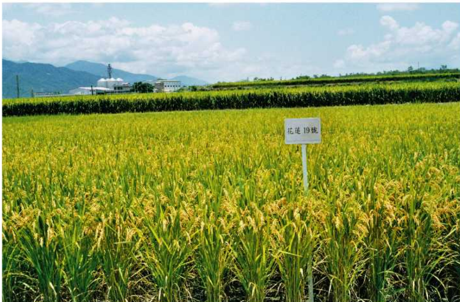
◀ 花蓮19號成熟期於田間生育情形

花蓮19號之稻熱病抵抗力表現穩定，在全省稻熱病病圃經過四年八期作檢定結果，葉稻熱病在嘉義市為抗至中抗級，在台東縣關山鎮為抗至感級；穗稻熱病抗性檢定，在嘉義市表現為中抗至中感，關山鎮為抗至感級；在旱田病圃檢定秧苗時，表現抗至中抗；花蓮19號對稻熱病抵抗力明顯要比台農67號強，因此栽培時應可減少施藥次數，唯在台東縣關山病圃葉稻熱病及穗稻熱病抗性較不穩定，在花蓮、台東地區仍應加以防治。對白葉枯病、紋枯病、縵葉枯病及飛蝨類不具抗性，二化螟蟲之抗性反應不穩定，因此栽培上應特別注意防治。