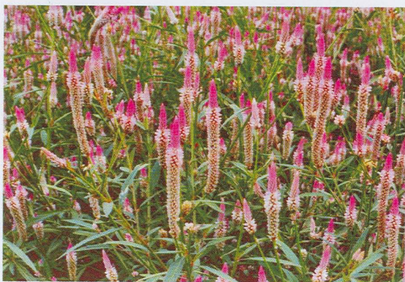
▲生性強健之青葙，花形呈火焰狀，花期甚長，適合作為景觀綠肥作物。本圖為青葙青葉種。