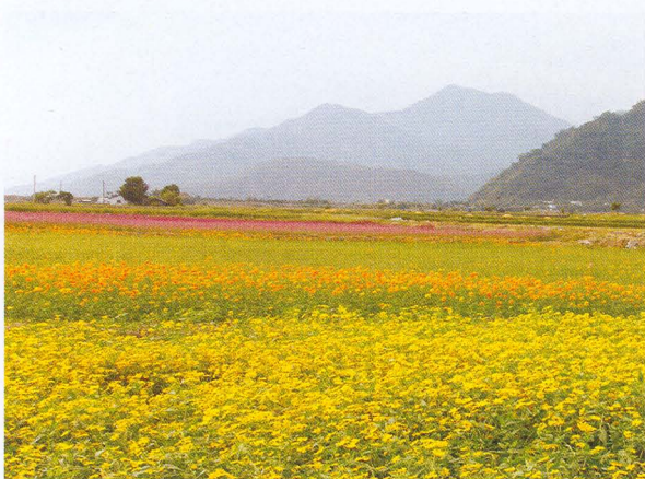
▲色彩繽紛之景觀綠肥作物色塊，常成為吸引路人注目的焦點。

農地是國土規劃的主要對象，也是生產的資本，不但保障國人溫飽，並且賺取外匯以提供工業發展的基礎；近年來休耕的農地到處可見，農業生產環境的變遷卻是很難抵擋的趨勢。目前為配合水旱田利用調整計畫，政府規定休耕田必須種植綠肥；同時我國加入世界貿易組織，依據談判結果必須開放國內稻米市場，為避免國外稻米進口後，造成國內生產過剩，讓市場價格大幅下跌，影響稻農收益，屆時休耕地種植綠肥作物栽培面積勢必逐年大幅增加。同時近年來農業為配合周休二日之休閒觀光政策，因應出生產、生活、生態之「三生」並重之產業調整，休閒農業、生態保育及農村生態景觀亦逐漸受到重視。對於過剩的農地，舒雅土地(amenity land)概念及舒雅造景(amenity landscaping)的技術，即守護田莊計畫(countryside stewardship schemes)是政府未來必須走的路，務必使荒廢農地，以提供正當休閒功能，成為社會大眾無可衡量的資產。