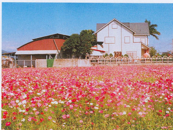
▲大波斯菊花色有白、黃、桃紅、紫紅或複色等，花姿柔美，風韻撩人，盛開時形成一片花海，頗富詩意。

海，美麗非凡；生性強健，容易栽培，不需特殊管理即能開花，很受喜愛，本省全年均可栽培，全年可見開花，開花結籽後，種子成熟掉落地面，經發芽後再成長，延綿持續開花。黃波斯菊對於栽培土質不拘，但以肥沃砂質壤土為佳，排水、日照需良好，蔭蔽處易造成徒長開花不良，播種量每公頃10~14公斤；苗高10公分時摘心1次，促使多生側枝，多開花，延長花期。