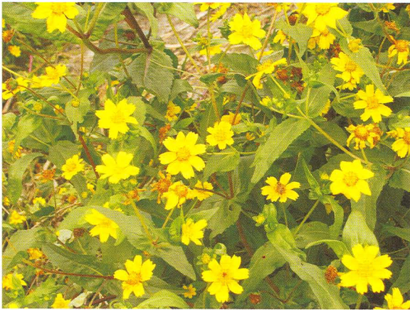
▲黃色驚艷—小油菊的黃色世界。

原產於依索匹亞高原，為菊科小葵子屬一年生雙子葉草本植物；株高0.3~1.8公尺，圓形直立中空莖桿，分枝性強，每對葉腋皆有分枝能力；播種後約50天開花，花期長達50~80天。抗旱耐瘠，對土壤適應性強，唯過於乾燥或低溼積水將使植株生育不良；水分需求高，旱季需特別注意水分管理，無法過於粗放栽培，同時生育後期容易倒伏。播種以整地栽培為佳，播種量每公頃10~12公斤，撒播。小油菊為短日照植物，春天種植時植株不開花，秋天種植方能開花。