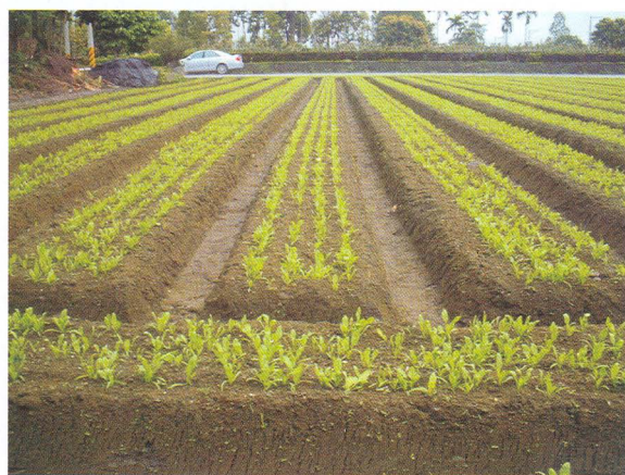
▲圖四、採用一貫作業機播種之菠菜生長情形

六、本機一次同時完成施肥、整地、作畦、播種多項作業，利用一貫作業械田間生長情形如圖四所示。本機每公頃所需作業時間僅需2~4小時，每公頃節省作業經費7,000元以上，一般作業與一貫作業機作業時間與費用之比較如表所示，使用本機充分節省經費並提升作業效率。