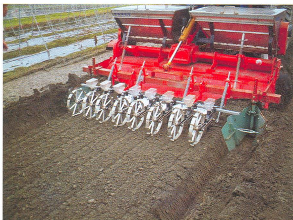
▲圖二、一貫作業機可做兩公尺寬畦床並同時播種八行